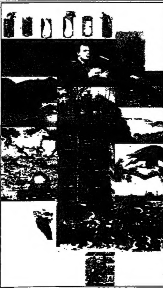
باريس - القدس العربية

احتفلت اليونسكو مؤخرا بصدور الموسوعة العربية العالمية الصادرة في المملكة العربية السعودية، ويضم من الامير سلطان بن عبد العزيز في 30 مجلدا ويتكلم قيمتها 10 ملايين دولار.